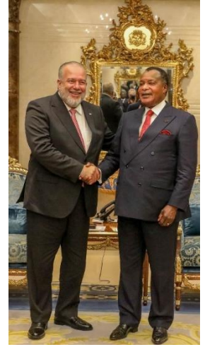
Cuban Prime Minister and Anatole Collinet Makosso, Prime Minister of the Republic of Congo.

قام رئيس الوزراء الكوبي مانويل ماريرو كروز بزيارة رسمية إلى جمهورية الكونغو، حيث أجرى محادثات رسمية مع نظيره أناتول كولينيت ماكوسو. كما قام سعادته بزيارة رسمية إلى ناميبيا لحضور حفل تنصيب الرئيس نيتومبو ناندي ندايتواه، والاحتفالات بالذكرى الخامسة والثلاثين للعلاقات الدبلوماسية بين البلدين و إلى غينيا الاستوائية في زيارة رسمية وتبادل الآراء مع السلطات هذه الدولة الصديقة.