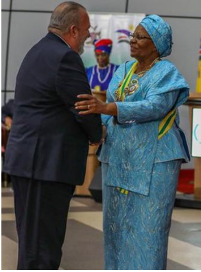
Cuban Prime Minister and Cuban Prime Minister and President of Namibia, Netumbo Nandi-Ndaitwah

Cuban Prime Minister Manuel Marrero Cruz made an official visit to the Republic of the Congo, where he held official talks with his counterpart, Anatole Collinet Makosso.