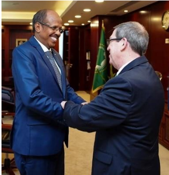
Cuban Foreign Minister and Mahamoud Ali Youssouf, Chairperson-elect of the African Union Commission.

Cuban Foreign Minister Bruno Rodríguez Parrilla made official and working visits to several African countries: South Africa, Ethiopia, Burkina Faso, Nigeria, Ghana, and Senegal. During his visit, the Cuban Foreign Minister carried out bilateral programs that included meetings with his counterparts and local authorities, as well as other activities with Cuban residents.