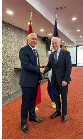
Cuba's First Deputy Minister of Foreign Affairs and his counterpart of Canada, David Morrison

The visit took place from March 17 to 21, within the framework of the celebration of the 80th anniversary of the establishment of diplomatic relations between the Republic of Cuba and Canada. During his stay in Canada, the Sixth Meeting of Inter-Ministerial Political Consultations took place. During this meeting, David Morrison, First Deputy Minister of the Canadian Foreign Ministry, ratified his country's favorable vote on the Cuban resolution at the United Nations demanding the lifting of the United States blockade against the island, as it is contrary to international law and has extraterritorial effects.